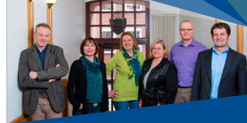
Ihr Kompetenz-Team vom TZEW

Wirtschaftsförderung im Landkreis Harburg GmbH